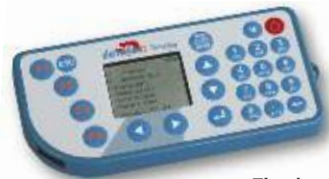
Timebox zur mobilen Zeit- u. Datenerfassung

Damit Ihre betriebliche Personalzeit einfach funktioniert, stehen die elektronisch erfassten Buchungen jederzeit für individuelle Auswertungen und Übersichten in der Zeiterfassungssoftware diTime zur Verfügung. Frei definierbare Zeitmodelle, interaktive, grafische Übersichten und die intuitive Bedienung garantieren ein Höchstmaß an Flexibilität in der Zeiterfassung.