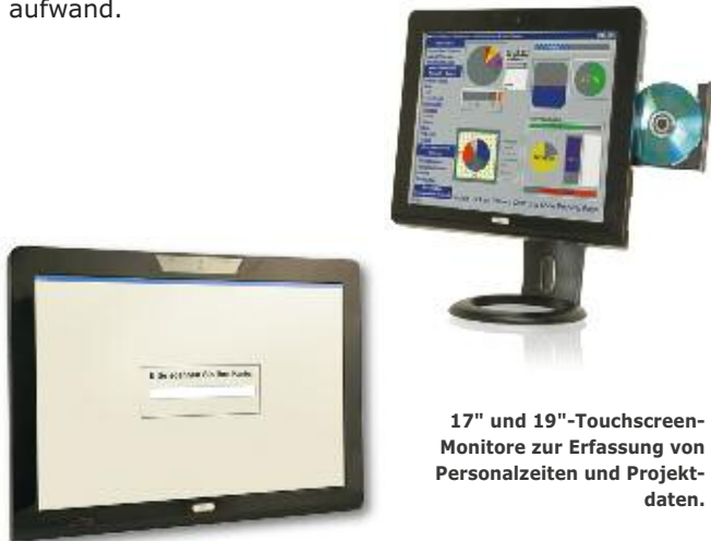
17" und 19"-Touchscreen-Monitore zur Erfassung von Personalzeiten und Projektdaten.

Die Zeiterfassung mit diTime reduziert Ihren administrativen Zeit- und Arbeitsaufwand.