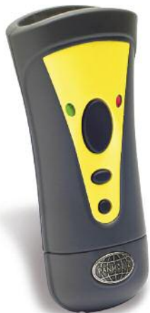
Beispiel für ein externes Erfassungsgerät

synergie kommunal GmbH ist auf die Beratung, Auswahl und Einführung von Softwarelösungen spezialisiert. Wir bieten alles, was Unternehmen und Verwaltungen an Software, Organisation und Wissen benötigen.